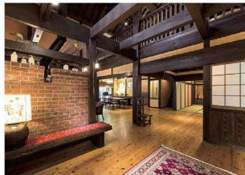
玄関を過って中に入るとリビングと和室が見渡せて、広さを感じられる通りに