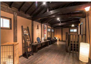
2層は柔らかい照明の光と木の温もりが感じられ、天井も高いので圧迫感を感じることがない