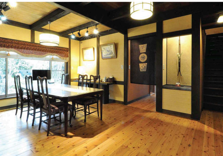
和テイストあふれるインテリアとおしゃれなニッチが季節感を演出