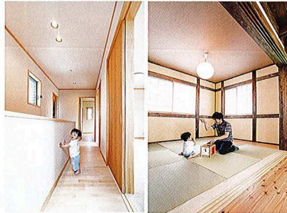
廊下 重厚な天井の1階に対して、夫婦の書斎や子ども部屋からなる2階は明るいイメージでまとめられている