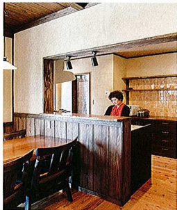
キッチン 対面式のキッチンや背後のカップボードは、ハウズランド社の造作品だ

「ハウズランド社」がつくった 筑紫野市在住ノYさんの住まい 古民家スタイルの家で暮らし 子育て世代の家づくり