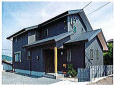
外観 高台に建つY家の外観。道路に面する側の窓は面積を抑え目にやさしい