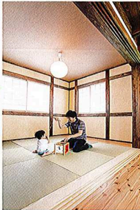
和室 玄関の正面に和室を設置。引戸を開ければリビングとひと続きになり、締めれば接客用のスペースになる