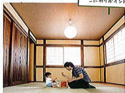
筑紫野市Y様邸の こびりポイント!