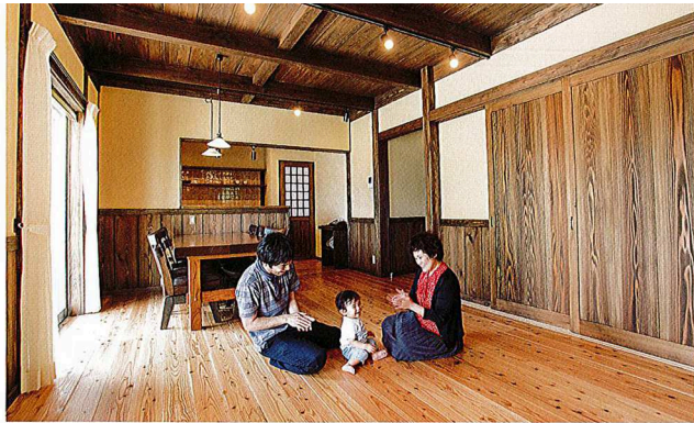
リビング & ダイニング 明るい日差しが射し込む古民家スタイルのLDKは、風の通りも抜群だ。6人掛けのダイニングテーブルもハウズランド社に造作してもらった逸品