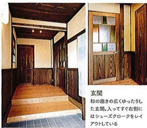
玄関 和の趣きの広くゆったりした玄関。入ってすぐ右側にはシューズクロークをレイアウトしている