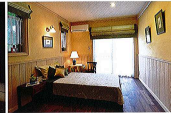
左ノ客間や茶の間など柔軟に使える和室は純和風の設え。丁寧な仕様が細部にも見て取れる。右ノボタニカルアートが似合いそうなナチュラルかつエレガントな寝室

オープンに人と人をつなぐ土間スタイルの暮らし 玄関だけでなくキッチンやダイニング、リビングまでがすべて土間。「風のくら」が提案するそんな土間スタイルの暮らしは、家の内と外とをゆるやかにつなぎ、人と人の距離を近くしてくれる。 たとえば、親しい近所さんが訪ねてきた時、「靴を脱いで上がるのも面倒だから」と、玄関先で立ち話になることが多いでも、土間空間なら靴のままキッチンやダイニングへ。カフェ感覚でお茶をしながらゆつくりと話ができる。ホームパーティーの楽しみだって広がります。 土だと湿気がこもる床も、タイルならその心配もなし。窓をベアガラスにして床下や壁に断熱材を入れたり、土間と相性のいい薪ストーブを置いたりと寒さ対策のアイデアも現代なら万全。夏は涼しく冬は温かな土間スタイルの暮らしが叶えられる。 「リフォームに耐え得る古民家をお持ちの方はごく限られていると思います。こうした土間スタイル