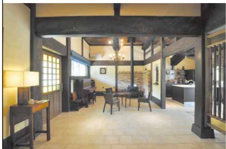
薪ストーブがおかれた土間には太い梁と高い吹抜け。木の香りと素朴な風合いの漆喰壁が優しく心地よい。