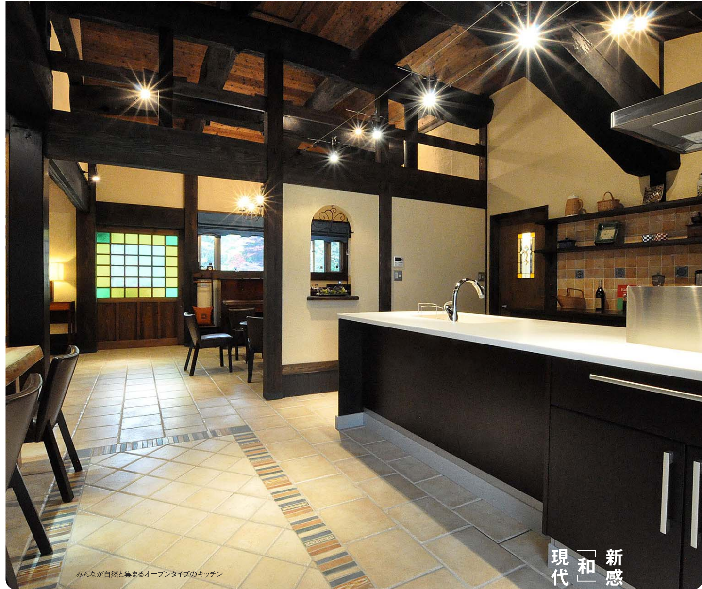
みんなが自然と集まるオープンタイプのキッチン